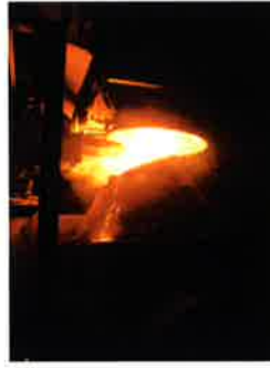
Stahl, Eisen, NE-Metalle