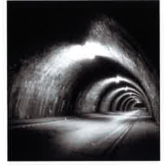
Berg- und Tunnelbau